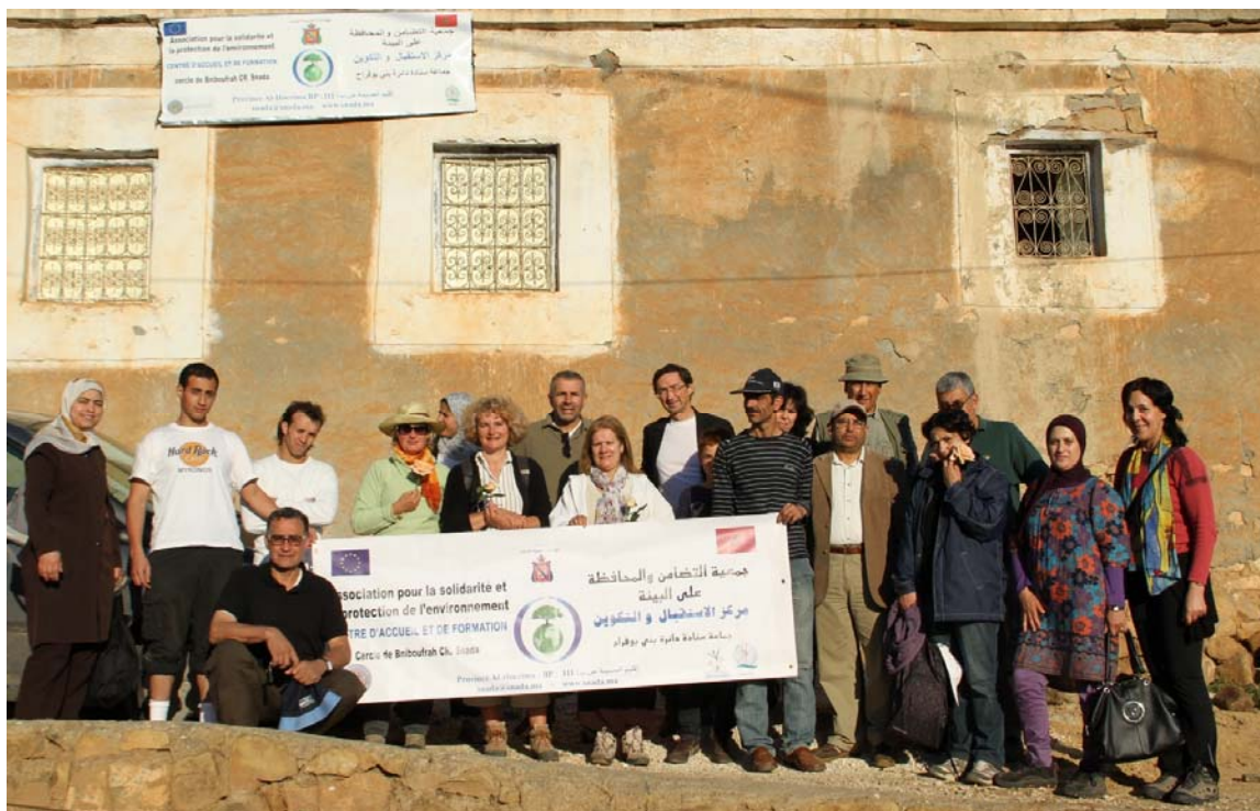
Centre d'accueil et de formation / Association solidarité et environnement de Snada

La journée du 22 mai commence par une petite découverte des environs du gîte. Une photo de groupe prise devant le gîte de Snada, puis un petit déjeuner traditionnel offert par l'association hôte et le départ en randonnée est donné : cap sur Badis.