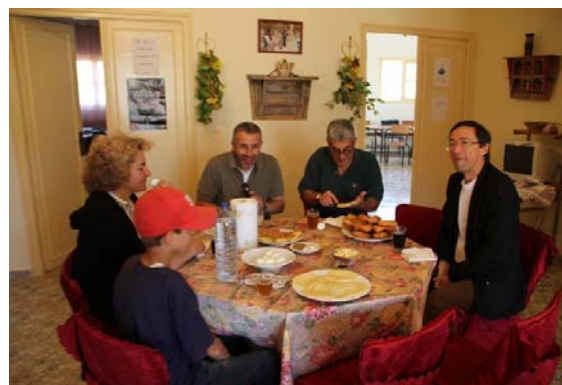
Petit déjeuner à Snada avant le départ vers Badis