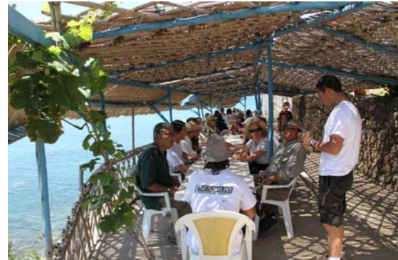
Sur le chemin du retour et déjeuner dans un restaurant situé sur la rocade.

Les propositions s'articulent autour des axes suivants :