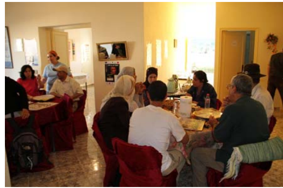
Accueil au siège de l'association Al Amal et échange avec ses responsables.

La première journée s'est terminée par une randonnée organisée autour de la kasbah de Snada. Celle-ci date de l'époque du Sultan Moulay Ismail (1672-1727) et faisait partie du réseau de forteresses qui servaient à maintenir l'ordre et à défendre le pays. La situation de la kasbah de Snada entre Fès et la côte rifaine, lui conférait un rôle certain dans la sécurisation des échanges commerciaux avec l'Europe à travers les ports rifains comme Badis présenté ci-dessous.