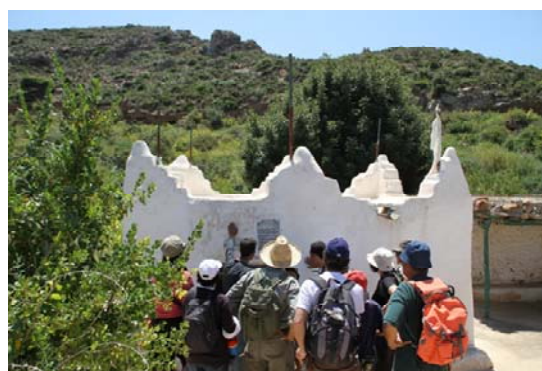
Visite de la coopérative d'artisanat et du Marabout Abou Yakoub Al badisi.

A la fin de la visite, les participants et les organisateurs étaient satisfaits du résultat. Ce qui est un premier signe de l'importance des potentialités touristiques des zones visitées et de