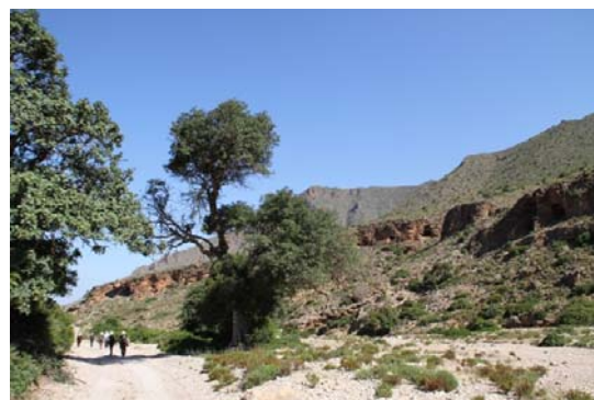
Quelques vues le long de l'oued qui mène à Badis.

Après une demi-heure de route en voiture à partir de Snada, Badis n'est méritée qu'après 2 heures de marche au fond de la vallée jusqu'à la mer. La marche est facile et agréable au