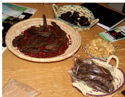
Présentation des produits de la coopérative par les représentantes de la structure aux participants.